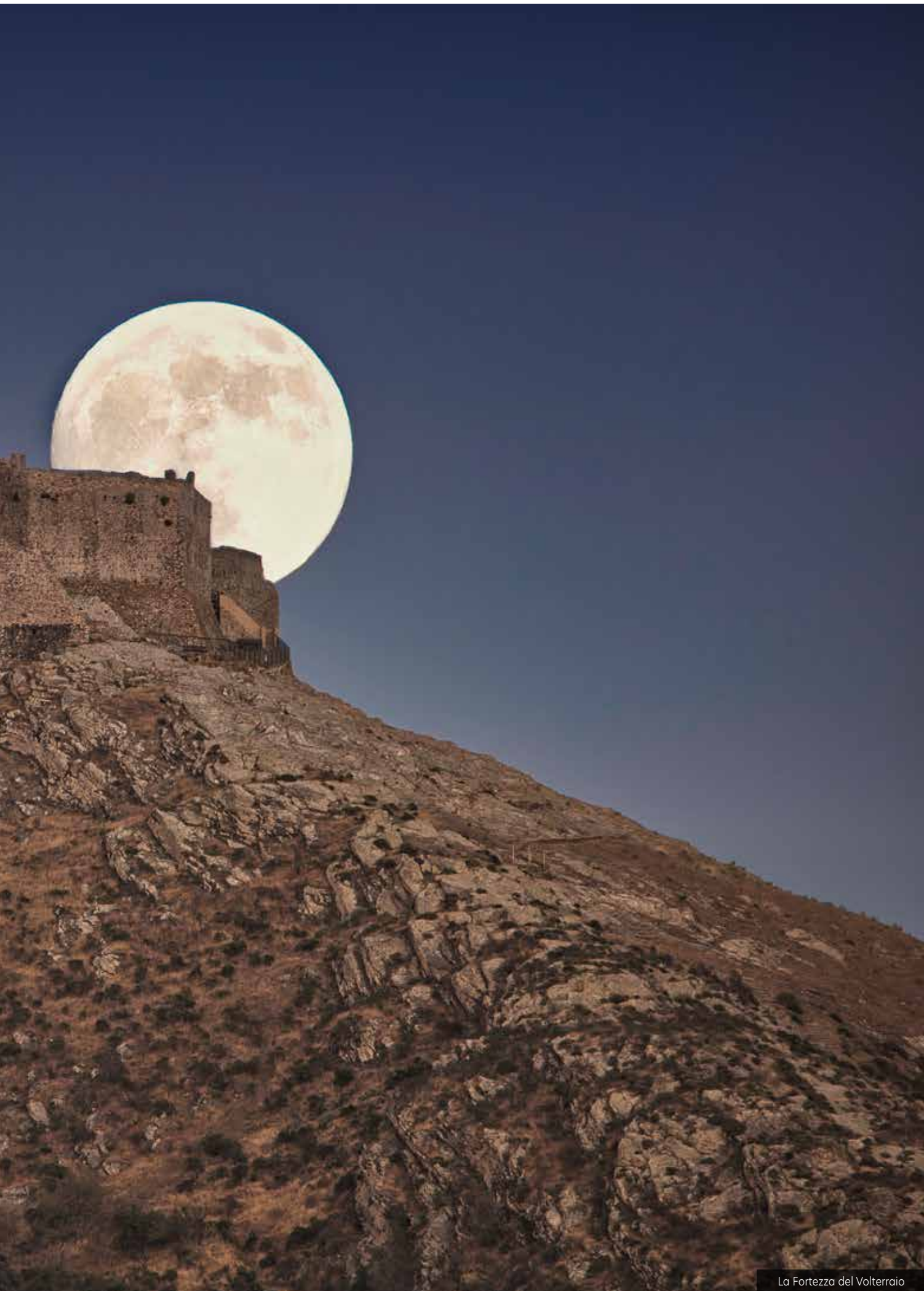
La Fortezza del Volterraio