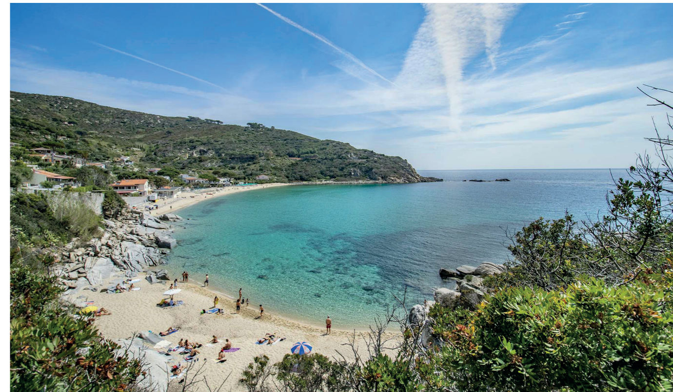
In alto a sinistra: il golfo di Portoferraio In basso a destra: la Spiaggia di Cavoli